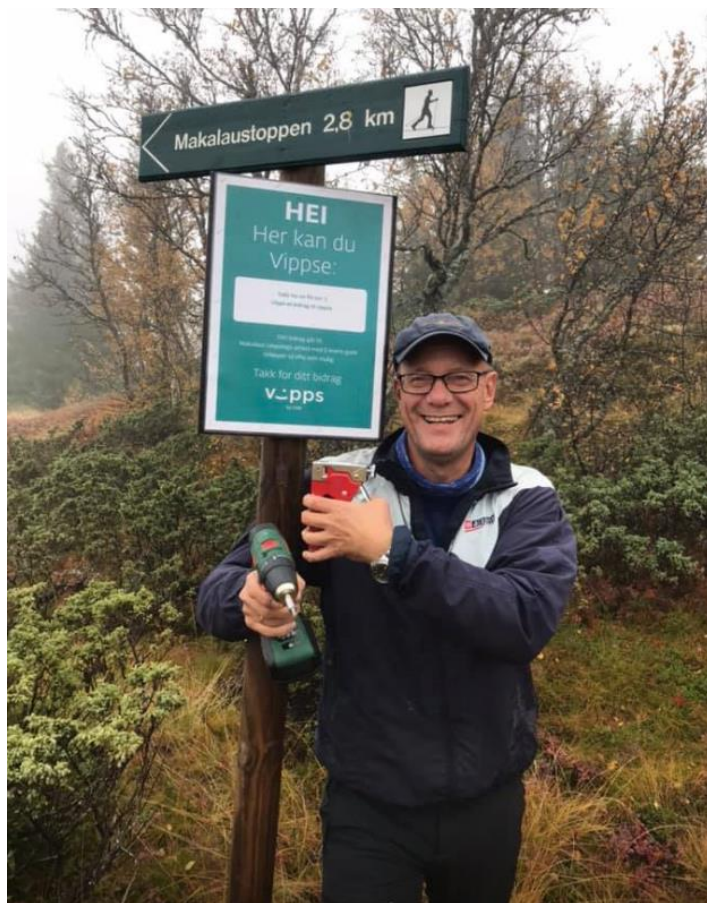
Her skal det bli Vipps-bidrag!