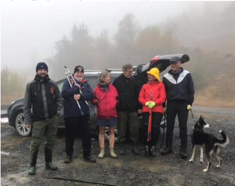
Dugnadsgjengen klare for innsats etter oppmøte